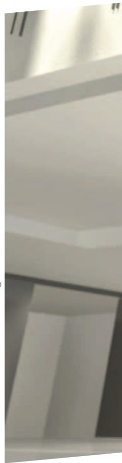
ZonarSound CZ 04/2014 | twindesign.cz